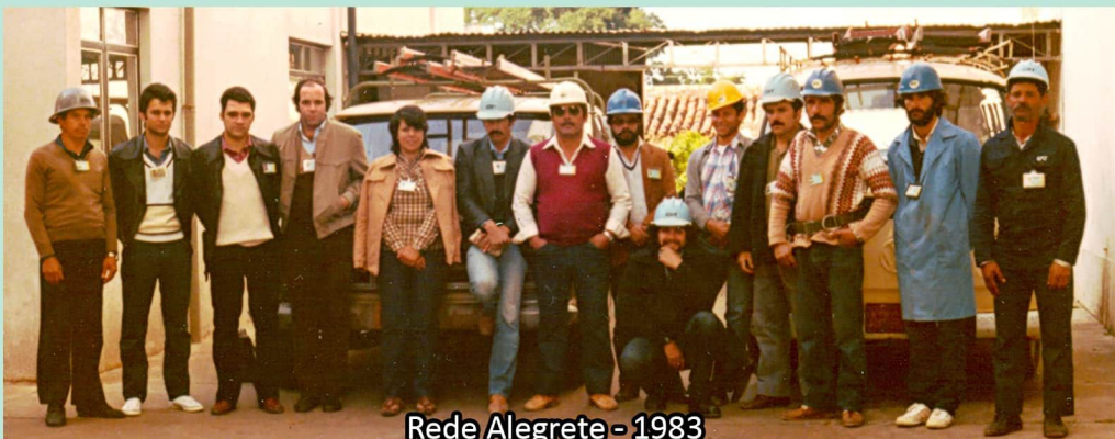
Rede Alegrete - 1983

Nossos parabéns aos homenageados e a toda a categoria de trabalhadores da Rede de Telefonia!