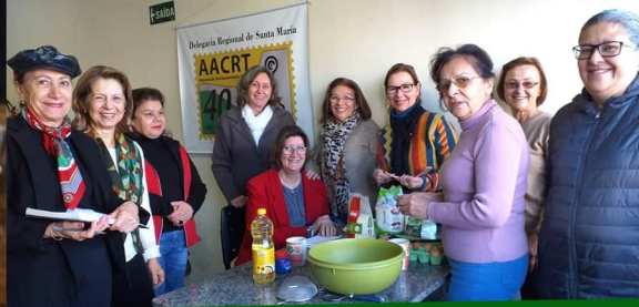
Oficina de Culinária, todas as quartas-feiras.