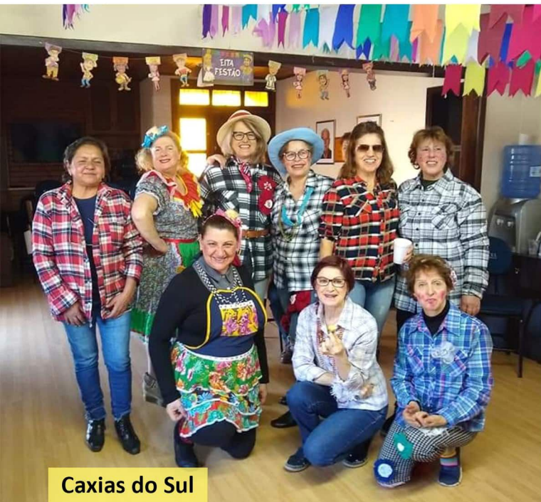
Caxias do Sul

Primeiro Chá na Delegacia de Lajeado, realizado no quiosque no dia 02/07.