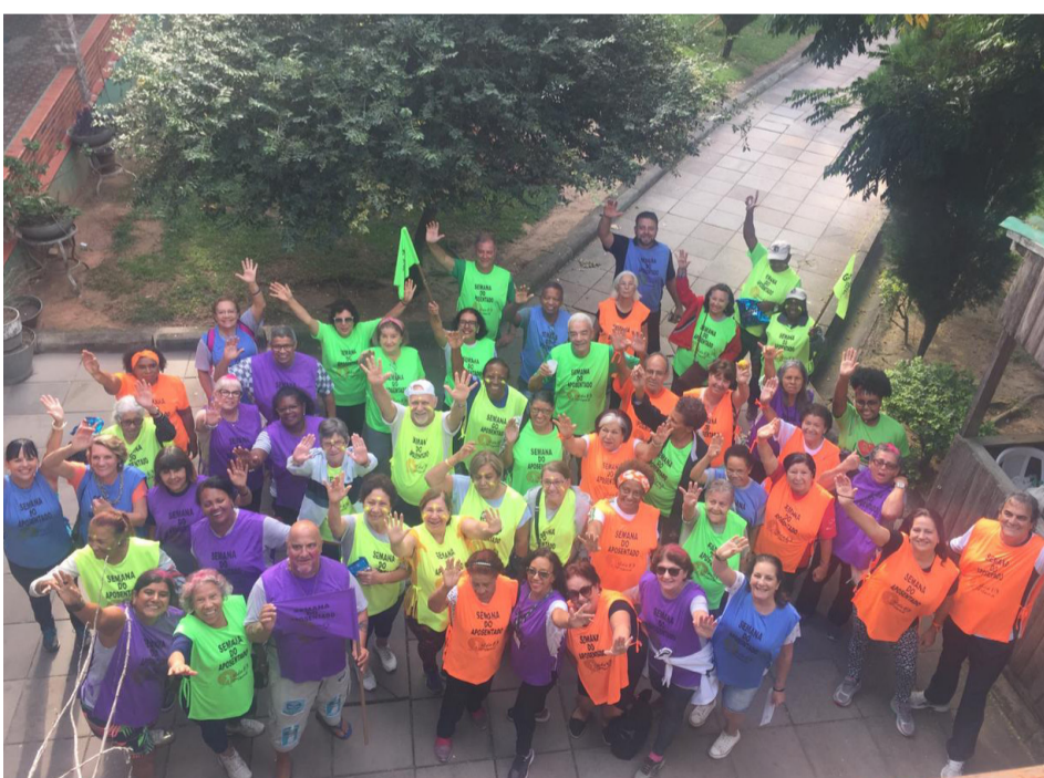
SEMANA DO APOSENTADO

AACRT e ASTTI negociaram com a Unimed Porto Alegre a prorrogação do prazo para que o usuário, ao migrar do plano de saúde regulamentado UNIMAX para o plano UNIPART, leve todo seu grupo familiar e não apenas seus dependentes legais. Este novo prazo vai até final do mês de novembro/2019.