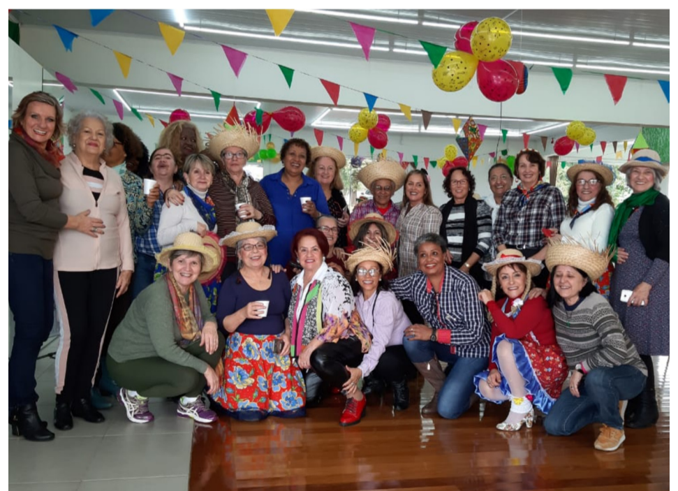
ARRAIAL DA TELEFONISTA