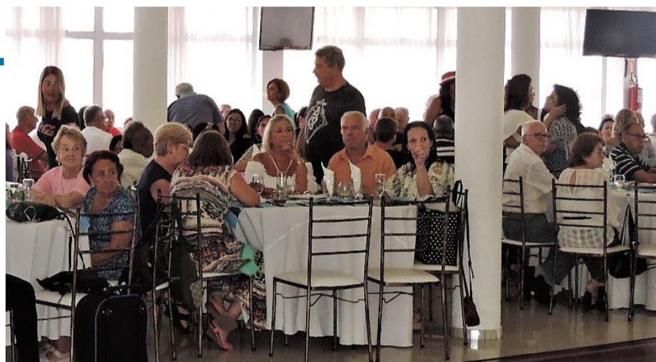
ALMOÇO E CHÁS em MARÇO