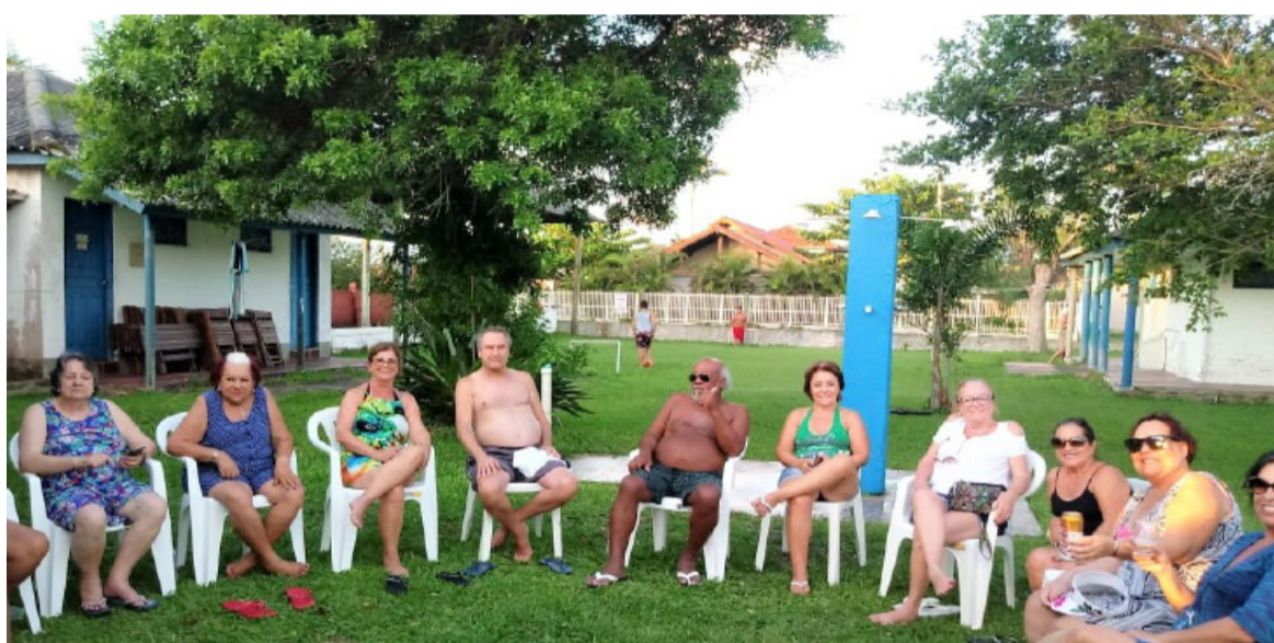
RONDINHA em JANEIRO