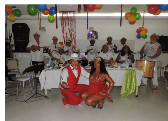
CARNAVAL em FEVEREIRO