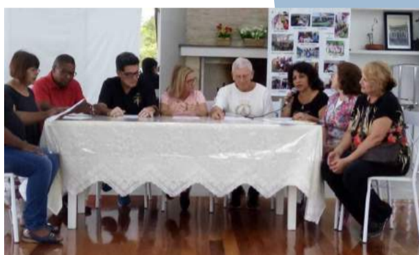
Oficina do Pensamento

O evento foi encerrado com a banda tocando até o momento de retornar a Porto Alegre.