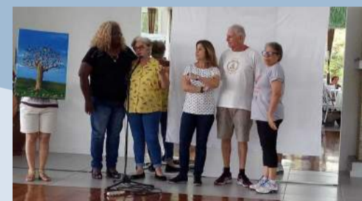
Oficina de Pintura