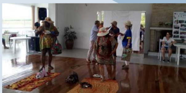
Oficina de Teatro