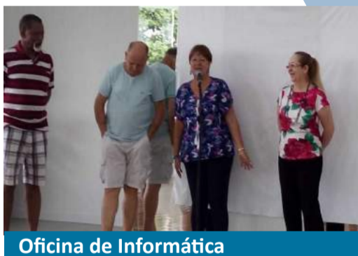
Oficina de Informática