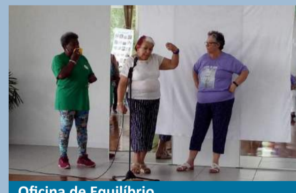
Oficina de Equilíbrio