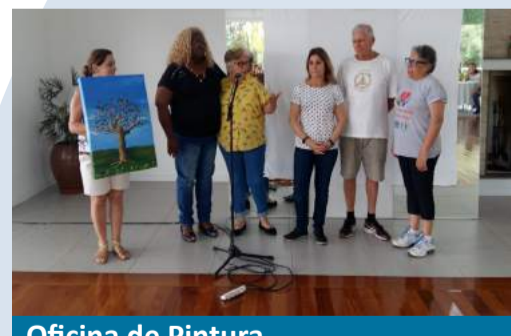
Oficina de Pintura