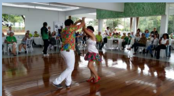
Oficina de Ritmo