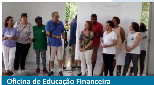
Oficina de Educação Financeira