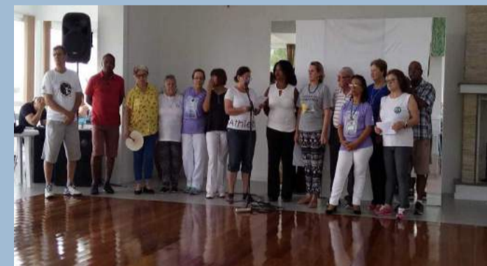
Oficina de Reike