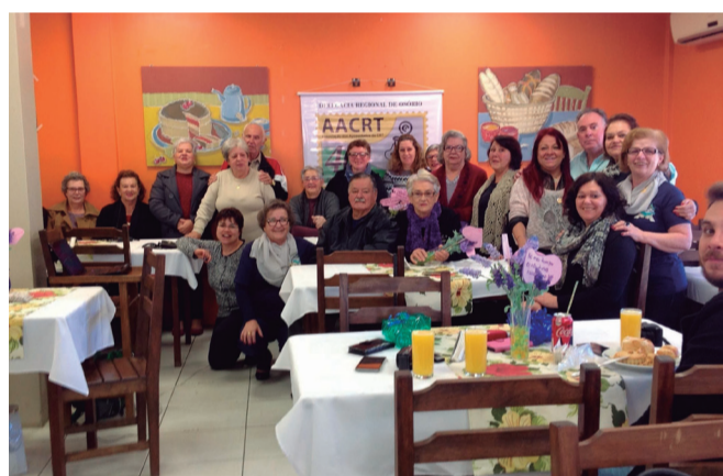
Dia 22/05 - Osório, Palmares do Sul e Santo Antônio da Patrulha.