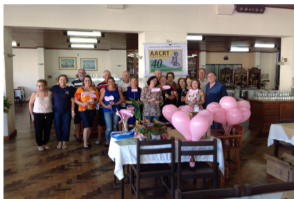
Dia 08/05 - Torres e Arroio do Sal;

A Delegacia de Osório, para comemorar o Mês das Mães, este ano optou por realizar um café em localidades polos. Uma experiência para aproximar mais os associados.