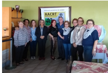
Dia 16/05 - Cidreira e Balneário Pinhal;