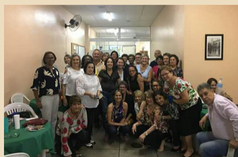
• Santa Cruz do Sul com Pelotas e Rio Grande – 18/04/2018