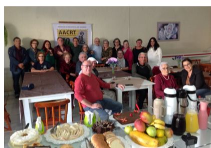
Dia 17/05 - Capão da Canoa e Xangri-lá;