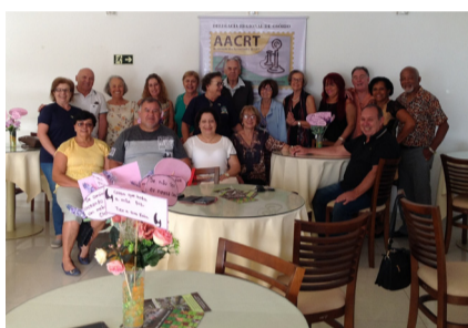
Dia 10/05 - Tramandaí e Imbé;